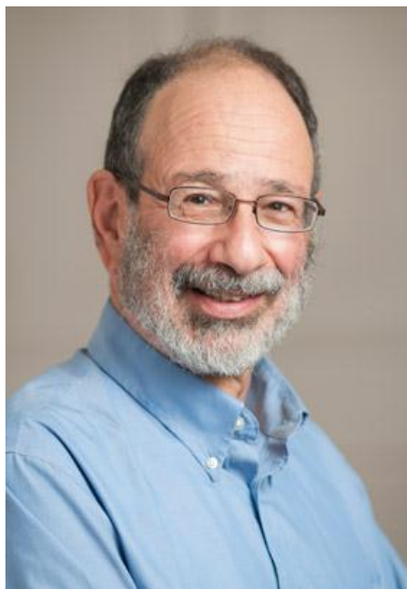
Alvin E. Roth