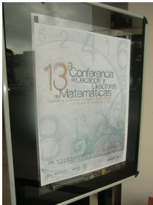
Cartel anunciador de la Conferencia de Decanos y Directores de Matemáticas